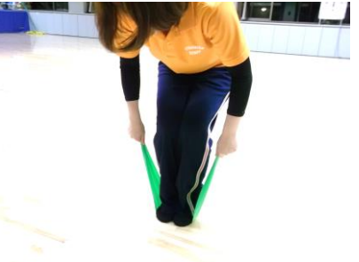
セラバンドを両足で踏み、両端をしっかりと握ります