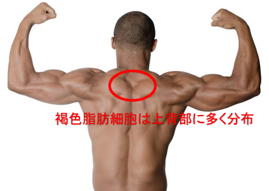
褐色脂肪細胞は上背部に多く分布

私達の身体には、憎きお腹のポヨポヨ脂肪を退治してくれる、頼もしいスーパー脂肪細胞が存在している事をご存知でしたか？ その名は『褐色脂肪細胞！』 この細胞組織は背中の上の辺りに集中して分布していて、使わないとどんどん小さくなってしまふ為、大事に閉まっている方は今すぐ使って増やす努力が必要です！ もう一つの特徴としては、熱を生産する為の組織なので、暑い夏にはほとんど活動しない為体温を上昇させたい今の時期こそ、存分に活躍してもらいたい細胞組織なんです。 では、早速褐色脂肪細胞を刺激して背中美人になりましょう！