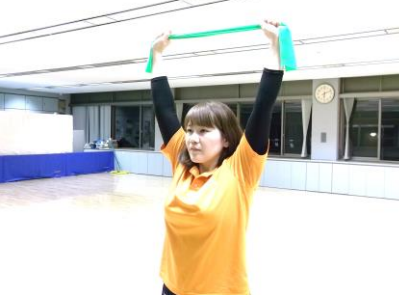
頭の上に持ち上げて横に引っ張ります