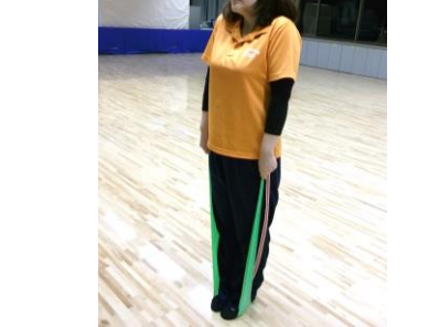
肩をすくめるように首の後ろを縮めるようにして上下に動かします