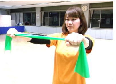
セラバンドを肩幅で握ります