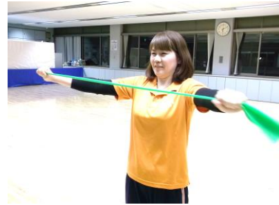
これ以上伸びない所まで引っ張ったら 細かく外に開きましょう