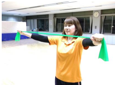
腕は真っ直ぐのばしたまま 肩の高さで横に引っ張ります