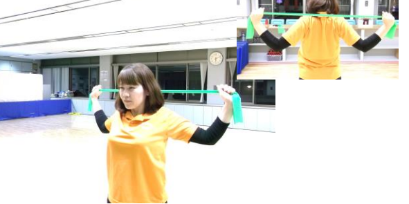
引っ張ったまま、首の後ろに降ろし、細かく上下に動かしましょう