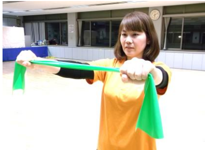
セラバンドを肩幅で握ります